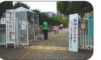
各団体地域行事 警備