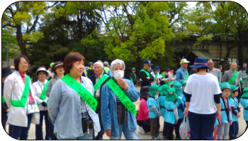
ひったクリーンママさんパト