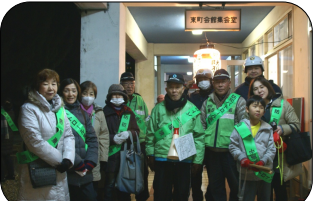
歳末夜警合同パトロール