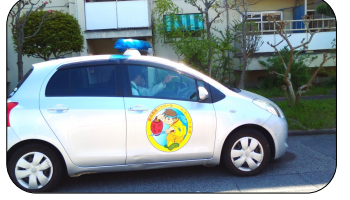
青パト おかっぴき隊