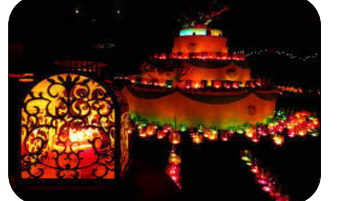
各団体地域行事 警備