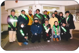
夏の合同パトロール