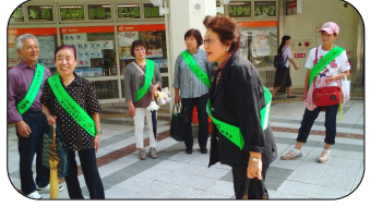
街頭キャンペーン